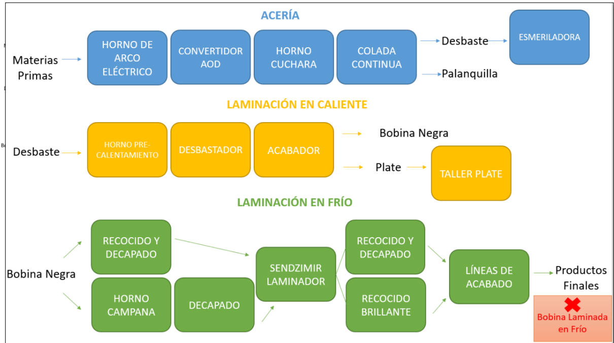
Figura 2: Proceso de laminación en frío.